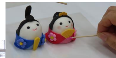
おひな様の出来上がり！