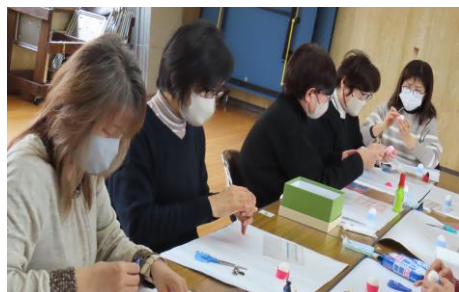
みなさん、一生懸命取り組んでいます