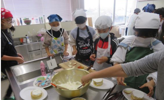
6年生17名の参加でプチケーキ作りをしました。