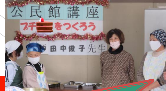
スポンジが温かいとクリームがとけるので講師が事前に土台をつくり冷ましてます。