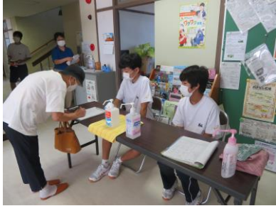
玄関で受付もしました。