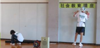
片付けも しました。