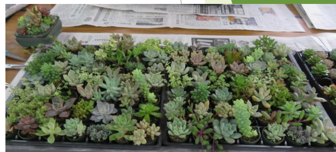
この二つから五個選びます