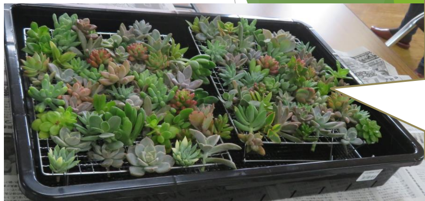
この中から十個選び