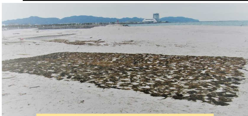
今年もモンバを入れました。